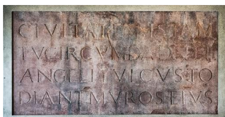
Die Inschriftentafel.

Eine aus der Gründungszeit des Klosters stammende Inschriftentafel, von der eine Kopie an der Doppelturmfassade des Westwerks die Besucher begrüßt, verweist auf die Civitas Corvey. Gemeint ist der mittelalterliche Klosterbezirk innerhalb der Mauern im Umfeld des Westwerks. „Umhege, o Herr, diese Stadt und lass deine Engel die Wächter ihrer Mauern sein“: Diesen Segenswunsch für die Civitas haben die Mönche in Stein meißeln lassen. Zum befestigten Klosterbezirk