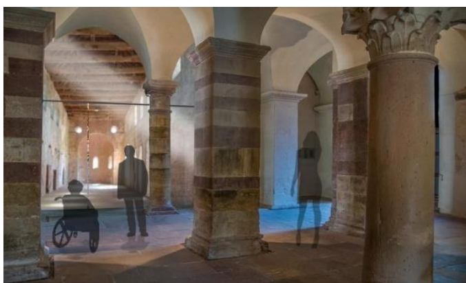
Der Blick in die karolingische Basilika krönt die Zeitreise im Erdgeschoss des Westwerks.

Fachleute des Fraunhofer-Instituts für Graphische Datenverarbeitung IGD haben neben archäologischen Funden aus den Grabungen der ehemaligen Abteikirche und Holzkeilfragmenten zur Befestigung der Stuckarbeiten an den Wänden die Original-Stuckfragmente der Figuren digitalisiert und rekonstruieren anhand dieser Scans und der Vorzeichnungen auf dem Mauerwerk die einst lebensgroßen Gestalten von heiligen Männern und Frauen. Wie – das werden die Gäste nachvollziehen können: „Der Vorgang des Scannens und die Rekonstruktion der Figuren unter Einbeziehung der erhaltenen Stuckfragmente wird eine Erzähllinie der Augmented Reality sein“, kündigt Professor Stiegemann an.