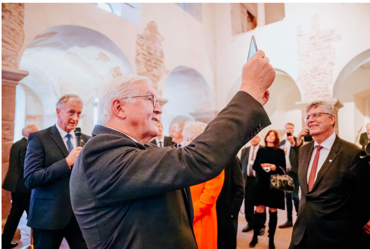
Bundespräsident Frank-Walter Steinmeier geht im Johanneschor mit dem Tablet in den Händen auf Zeitreise. Auf dem Bildschirm erblüht die Original-Ausgestaltung des erhabenen Sakralraums.