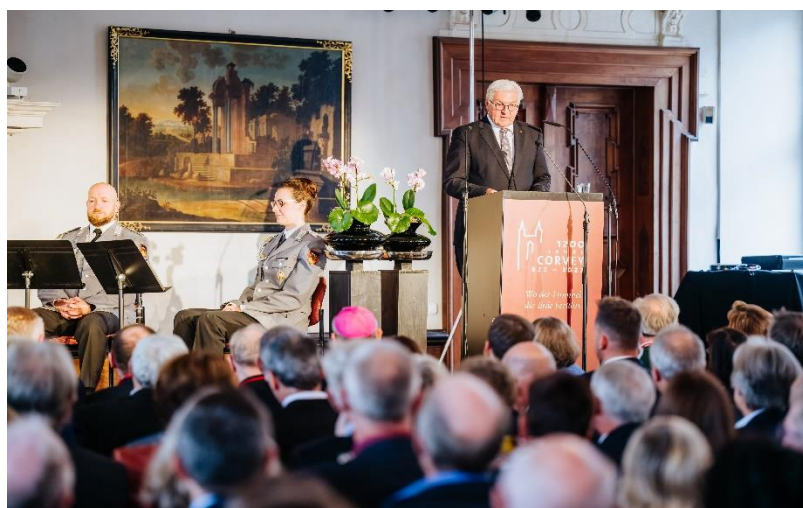
Bundespräsident Frank-Walter Steinmeier beim Festakt im Kaisersaal des Schlosses Corvey. Der Besuch des Staatsoberhauptes war ein großer Tag für die Welterbestätte.