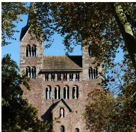
Die Fassade des Westwerks ist das Gesicht des Welterbes.

Einzigartiger Kulturschatz und Meisterwerk karolingischer Baukunst