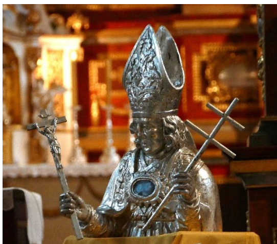
Das Kopf-Reliquiar für den Heiligen Ansgar.

Zu Corveys Strahlkraft als Missionszentrum hat der heilige Ansgar (801 – 865) beigetragen: Als junger Mönch gehörte er 822 zu den ersten Ordensmännern aus Corbie, die das Kloster an der Weser gründeten. Er leitete in der neuen Abtei die Klosterschule und brach von dort aus zu Missionsreisen auf. Diese führten ihn nach Dänemark und Schweden und 834 in die Vorgängersiedlung Hamburgs. Dort baute Ansgar als Missionsbischof die erste Kirche.